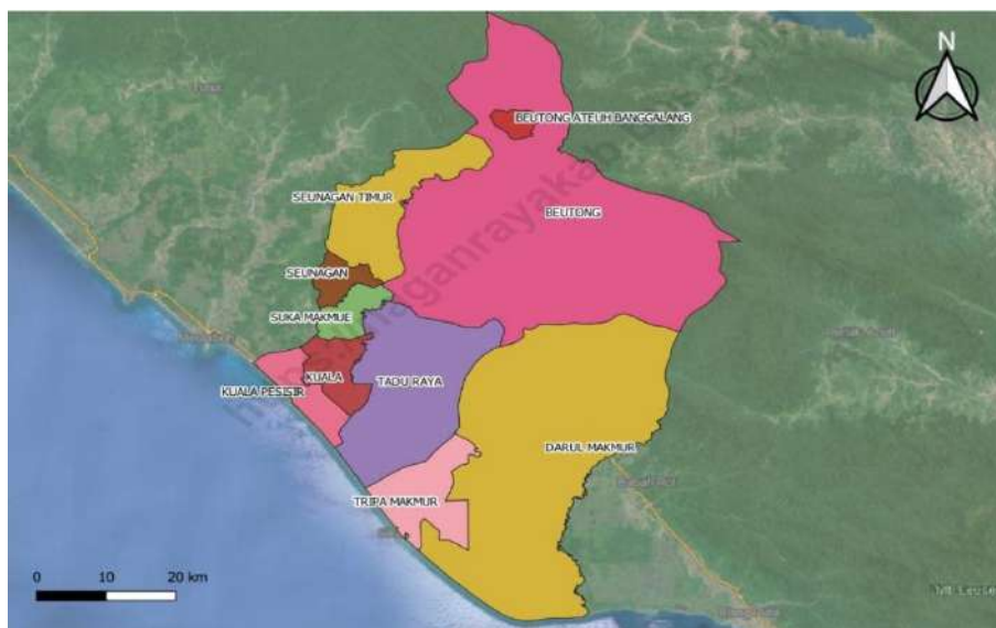
Gambar 1.1 Peta Wilayah Administrasi Kabupaten Nagan Raya